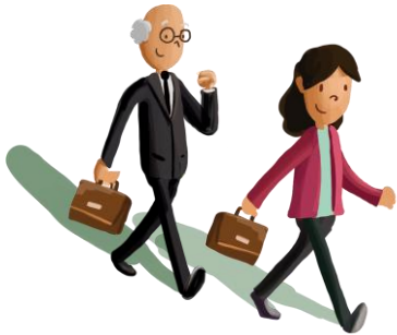
Wirtschaft und Finanzmarkt